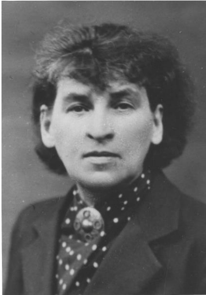
La photographie dans le passeport de 1940

édition de L'Isomé se fonde sur le texte publié par Stock en 1942 et reprend les dessins que l'autrice avait réalisés pour cette édition de luxe. Le présent volume inclut également de nombreuses pages tirées du légendaire « Journal de bord de L'Isomé », ainsi qu'une riche biographie de l'autrice due à Charles Linsmayer, historien de la littérature zurichois dont le travail a été maintes fois récompensé.